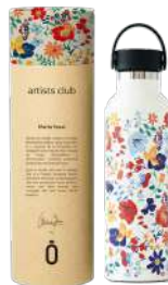
spring nata 971811

60 cl. térmico, hermético, recubrimiento interior cerámico, base antideslizante, textura brillante.