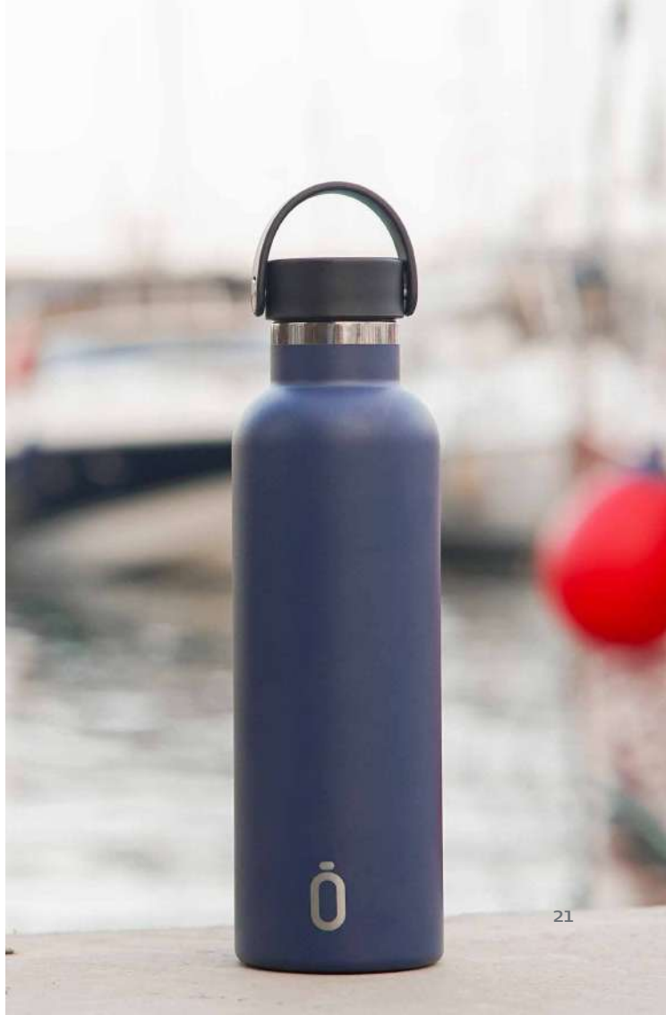
Runbott sport 75 cl.