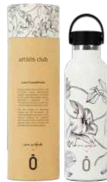
night flower 971761