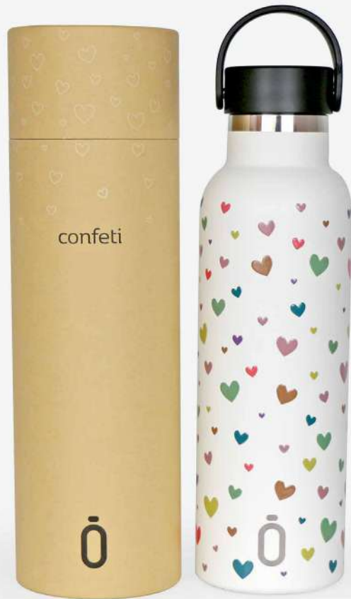
Runbott confeti 60 cl.