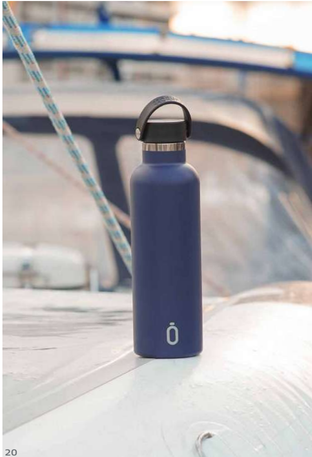
Runbott sport 75 cl.