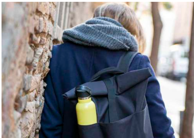
Runbott sport 60 cl.