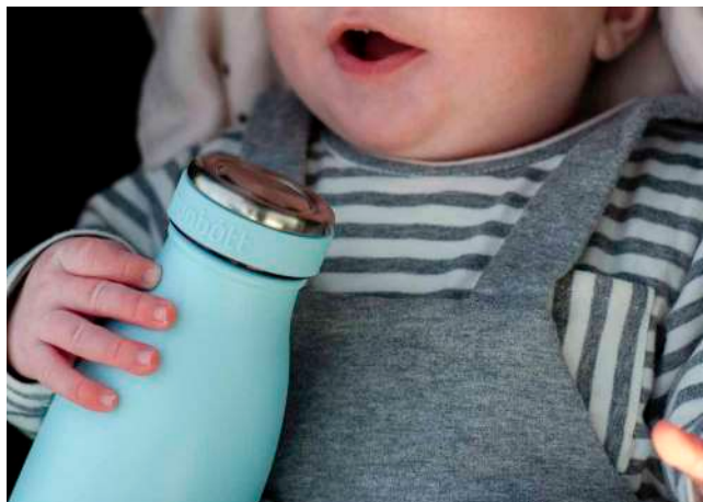
Runbott city 35 cl.