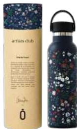
spring marino 971812