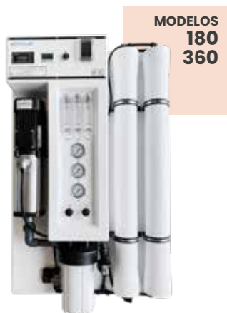
MODELOS 180 360

(1) +/- 10% a la puesta en marcha con la salinidad máxima indicada (en NaCl) en la tabla, 20 °C de temperatura, pH 7 y 50% de recuperación. La producción disminuye con mayor cantidad de sólidos disueltos o con menor temperatura y viceversa. Las prestaciones de los equipos están calculadas con una temperatura del agua a tratar de 20 °C.