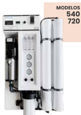
MODELOS 540 720