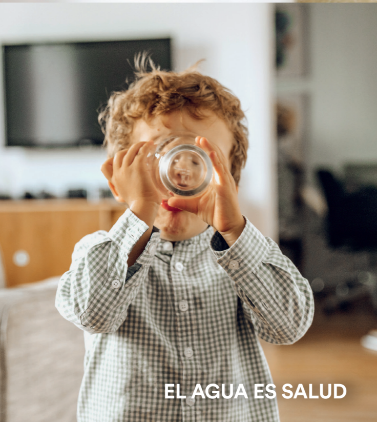
EL AGUA ES SALUD