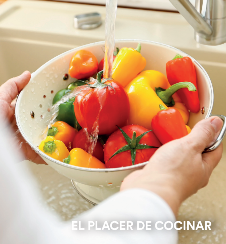
EL PLACER DE COCINAR